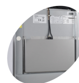
Système de dégivrage automatique